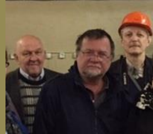
Группа Нейтронной Физики