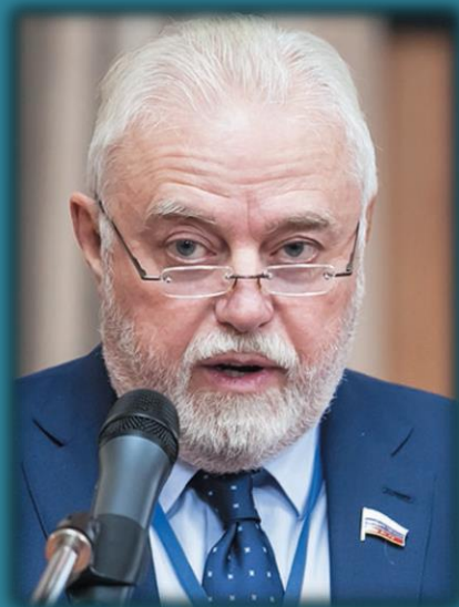
Игорь Борисович Дивинский, первый заместитель Председателя Комитета по финансовому рынку Государственной Думы Федерального Собрания Российской Федерации

«Тема сегодняшнего мероприятия совершенно точно характеризует наступившую эру, и наша конференция как нельзя более своевременна. Задача финансовых IT-компаний, регулятора и политиков заключается в гарантированном развитии технологий таким образом, чтобы обеспечить максимальные возможности и свести к минимуму риски для нашего общества»