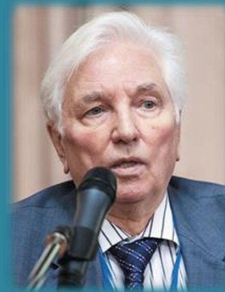
Геннадий Андреевич Месяц, академик Российской академии наук, член Президиума РАН

И те гигантские усилия, о которых говорил Юрий Анатольевич Чиханчин, связанные с работой Международного сетевого института в сфере ПОД/ФТ – исключительно важное и большое дело»